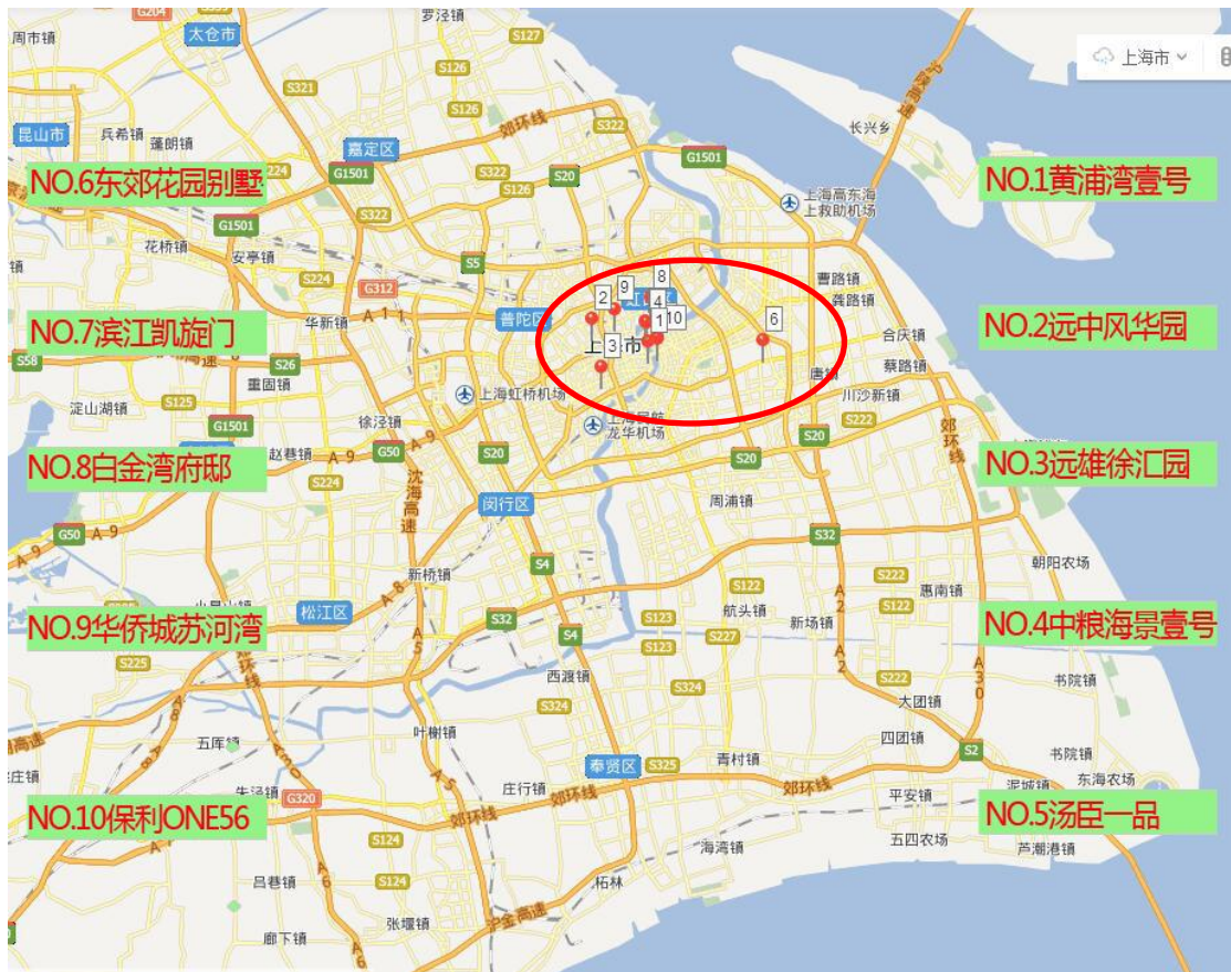
图 1 上海十大超级豪宅分布

上海十大超级豪宅主要分布在内环线以内（仅第六名东郊花园别墅除外，其位于内环与中环之间）。另外，十大豪宅中有 7 处位于滨江或临河地段，6 处位于黄浦江滨江地区，1 处位于苏州河湾处，由此可见：上海豪宅多偏爱地标性江景。余下的 3 处豪宅 1 处坐拥新天地、徐家汇两大 CBD 商圈，1 处邻近张江高科技园区与金桥出口加工区，世界 500 强高层人士云集之地，另 1 处是位于寸土寸金的静安区，毗邻南京西路商圈。